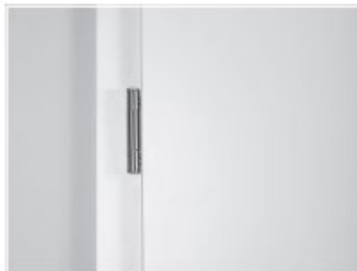
Bänder V4426 Edelstahl-Look